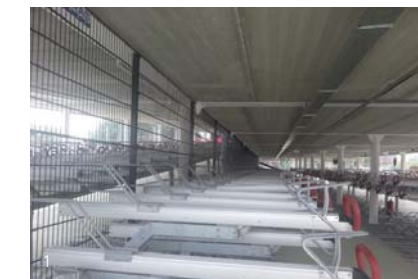
5. Technologische ontwikkelingen in Helmond