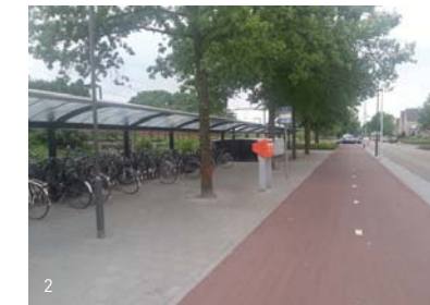
2. Fietspad Helmond-Eindhoven