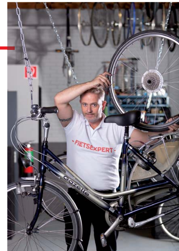
Ook de Helmondse fietszaken worden betrokken bij promotieacties

De resultaten van veel acties worden in 2014 duidelijk. Blijkt deze aanpak niet afdoende? Dan trekken we nog meer uit de kast, om ergernis weg te nemen.