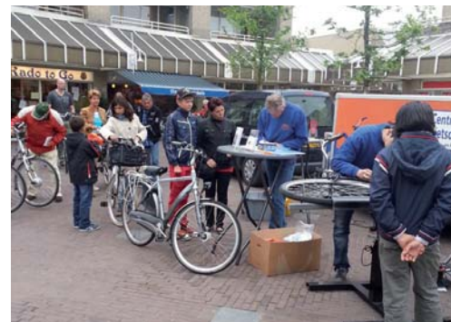
Licht kapot? een aantal keer per jaar kunnen Helmonders hun licht laten repareren

Valgevaar in de winter? Geen goed idee. Alle fietsroutes die onderdeel uitmaken van het primaire fietsnetwerk worden wanneer er gladheid wordt verwacht direct gestrooid en/of geveegd. Indien de gladheid aan blijft houden worden ook andere fietsroutes gestrooid en/of geveegd. Voor het strooien van de fietspaden zijn aparte wagens beschikbaar.