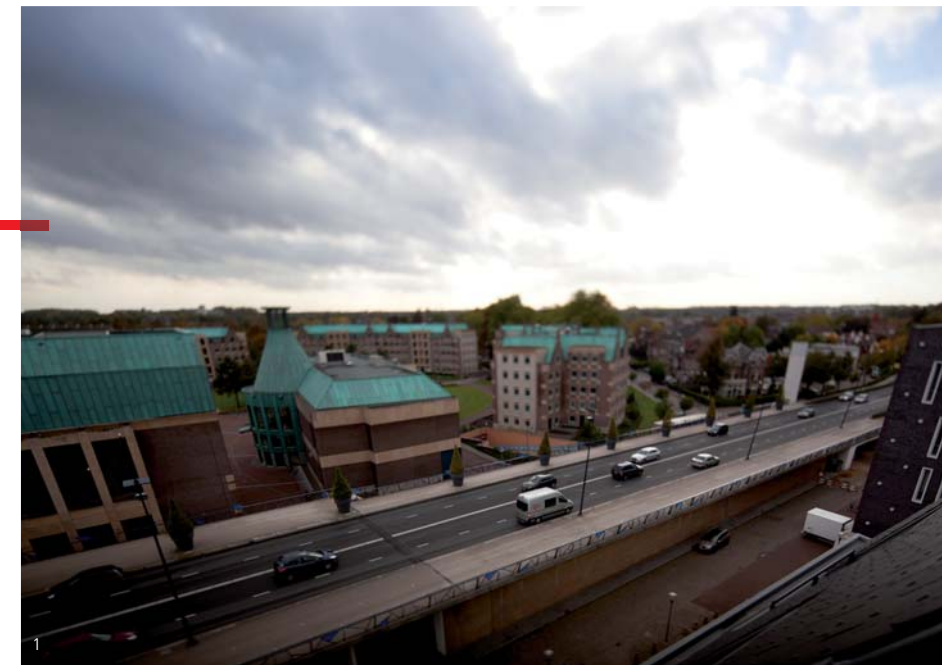
1) Verkeersader Kasteeltraverse 2) AutomotiveCampusNL 3) Stoffenfabrikant Vlisco 4) FoodTechPark 5) Nieuwbouwwijk Brandevoort

Met het oog op de uitbreiding van het centrum, wordt ook alvast gekeken naar de faciliteiten voor fietsers. Er zal extra capaciteit komen in bewaakte stallingen.