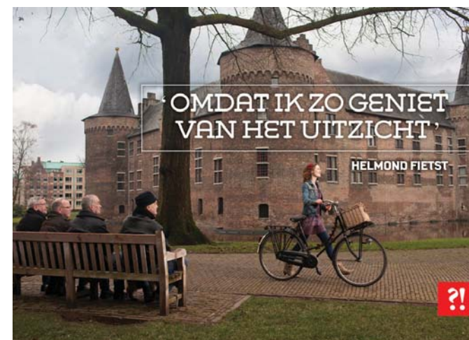
Campagnebeelden lancering Helmond Fietst

Prima resultaten op fietsgebied. Die behaal je niet alleen. Samenwerking met zowel interne als externe partijen, is dan essentieel. Samen bereik je veel meer. De gemeente brengt partijen bij elkaar, adviseert en faciliteert waar nodig activiteiten. Samenwerking is volgens ons 'the key to success'. We werken in Helmond op diverse gebieden samen. Zo hebben we voor onze fietsverlichtingsacties