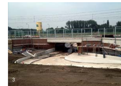
3. Fietstunnel nabij Station Brandevoort

Helmond heeft veel geïnvesteerd in de aanleg van fietspaden, maar ook zeker in het verbeteren van de kwaliteit van bestaande fietspaden. Het gaat dan niet zozeer om klein onderhoud, maar ook om complete rehabilitatie waarbij tegels worden vervangen door voldoende brede asfaltpaden met verlichting en zo min mogelijk oponthoud. In de actieplannen fiets van de laatste jaren staan de verschillende projecten weergegeven. De actieplannen fiets 2010 t/m 2013 zijn als bijlage bijgevoegd.