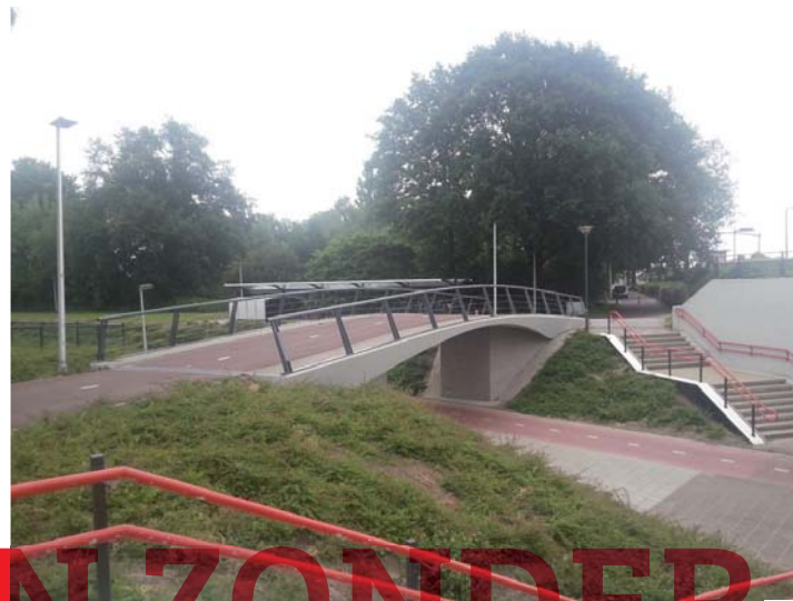
Eén van de aanwezige fietsbruggen in Helmond