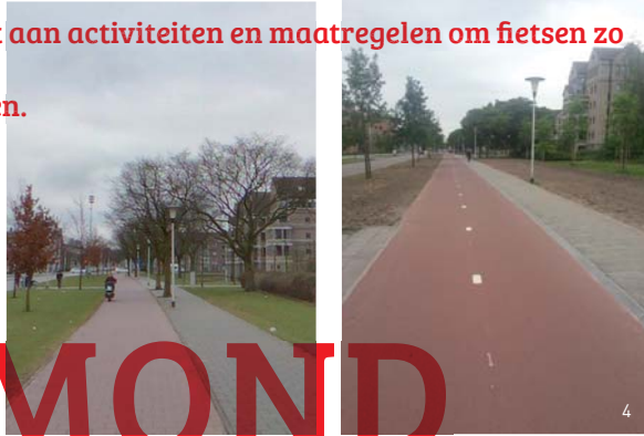
4. Kwaliteitsverbetering Keizerin Marialaan, voor en na