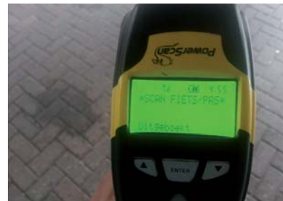
Het geautomatiseerde toegangscontrolesysteem

Gemeente Helmond gaat in 2013 middelbare scholen benaderen en verzoeken om te zorgen voor fatsoenlijke- en voldoende fietsrekken. Dit draagt bij aan de verkeersveiligheid. Want als je je fiets veilig kunt stallen, heb je minder kans op beschadigingen aan je fiets of fietsverlichting. Ook draagt een betere stalling bij aan een terugloop van het aantal fietsdiefstallen, omdat fietsen gemakkelijker vast gelegd kunnen worden aan het rek.