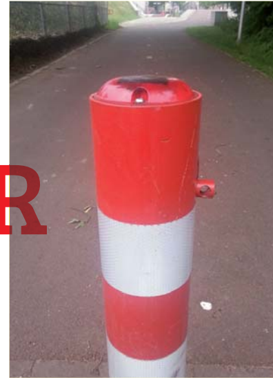
Een paaltje mét ledverlichting, zodat deze te allen tijde goed zichtbaar is