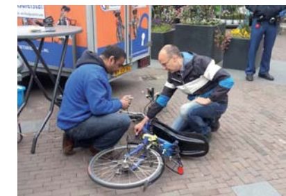
Er worden jaarlijks op diverse plekken in de stad graveeracties gehouden