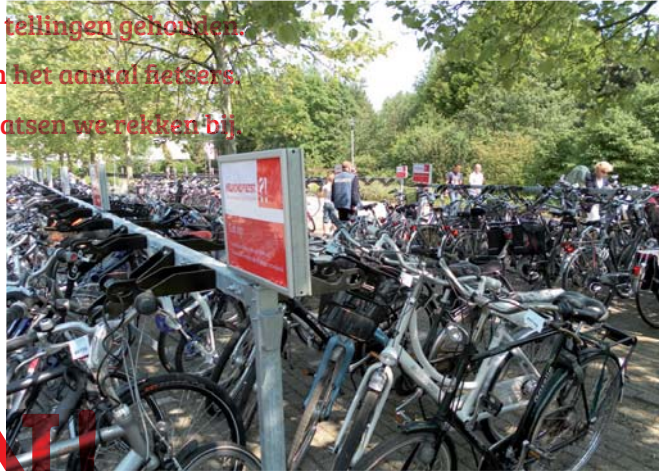
Een mobiele stalling

Het fietsparkeren is in Helmond prima op orde. Dat blijkt uit de Fietsbalans uit 2007, waarin Helmond op dit thema bovengemiddeld scoorde. Maar: Helmond wil méér. Daarom is er de laatste zes jaar geïnvesteerd in het vervangen en/ of bijplaatsen van fietsenrekken op diverse locaties. De fietsenrekken voldoen aan de norm FietsPar-Keur. Vanwege de uniformiteit is de Tulip gekozen als standaardrek. Hoeveel fietsrekken plaats je? Gemeente Helmond heeft voor deze beslissing tellingen gehouden. Daarnaast houden we rekening met de te verwachten groei van het aantal fietsers. Toch onverwachts een tekort aan parkeergelegenheid? Dan plaatsen we rekken bij. Hieronder behandelen we een aantal locaties: