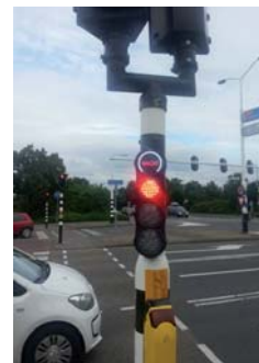
Een wachttijdvoorspeller zodat de fietser precies weet hoe lang hij nog moet wachten. Dat voorkomt een hoop ergernis

Een stoplicht vormt, hoe je het ook wendt of keert, een hindernis. Een hindernis die je niet zomaar weg kunt nemen. Maar we kunnen wel een deel van de ergernis wegnemen. Vaak vragen fietsers en voetgangers zich af: hoe lang duurt dit nog? De verleiding om door het rood te fietsen is dan groot, terwijl enkele seconden later het licht op groen springt. De oplossing? Een wachttijdsensor. Zo weet je precies hoe lang je moet wachten. De wachttijdvoorspellers zijn op een aantal locaties geplaatst, en dat aantal zal nog verder toenemen.