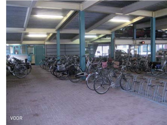
De opgeknapte fietsenstalling 'Doorneind' in Helmond centrum

Ook laat de gemeente net als de andere B5 steden dit jaar een netwerkanalyse uitvoeren door de Fietsersbond. De resultaten van deze analyse geven een goed inzicht in de hindernissen die we nog kunnen en moeten nemen. De resultaten worden begin 2014 verwacht en vormen mede de basis voor het nieuwe Fietsbeleidsplan.