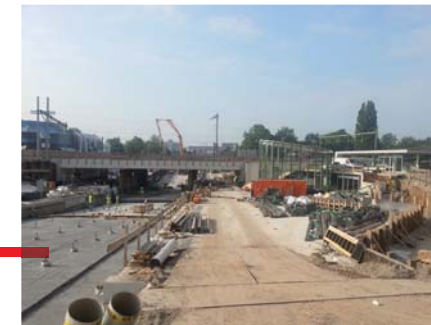
De nieuwe spoortunnel bij Helmond centraal is volop in aanbouw

Bij het opstellen van nieuwe regelingen voor de verkeersregelinstanties in Helmond worden keuzes gemaakt over de prioritering van de af te handelen modaliteiten en richtingen, waarbij ook de functie van het netwerk nog bepalend is. Dit betekent in een aantal gevallen dat fietsers een hogere prioriteit krijgen, mits dit uiteraard niet leidt tot grote verkeersproblemen op andere richtingen.