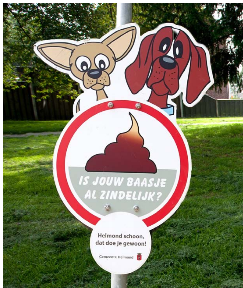
De gemeente heft hondenbelasting om met dat geld de overlast van hondenpoep tegen te gaan (fotografie Pressvisuals).

De grootste inkomstenbron van onze gemeente is de bijdrage van de Rijksoverheid. Een bijdrage, die doorlopend verlaagd wordt. Dat is meteen een belangrijke oorzaak van de noodzaak om te bezuinigen. Een gemeente heeft ook inkomsten uit lokale heffingen. De bekendste zijn natuurlijk de onroerend zaakbelasting (OZB), de riool- en afvalstoffenheffing en de hondenbelasting. Maar een gemeente vraagt ook geld voor een bouwvergunning of voor een rijbewijs of paspoort.