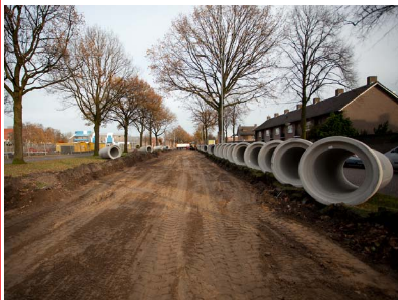
Met de rioolheffing financiert de gemeente onder andere de aanleg van nieuwe riolering.

De prijs voor een rijbewijs gaat omlaag van € 57,40 naar € 38,48. Enkele vergunningen worden wel extra duurder, omdat de gemeente er meer werk mee heeft. De aanvrager betaalt dan de extra kosten. De grondprijzen voor woningen blijven hetzelfde.