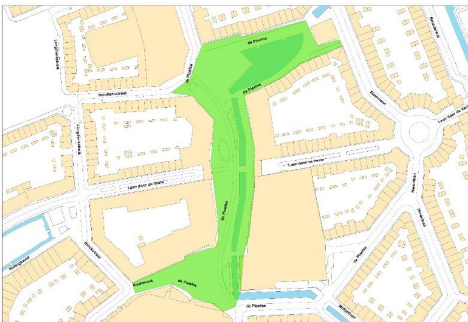
Figuur 2 plattegrond De Plaetse